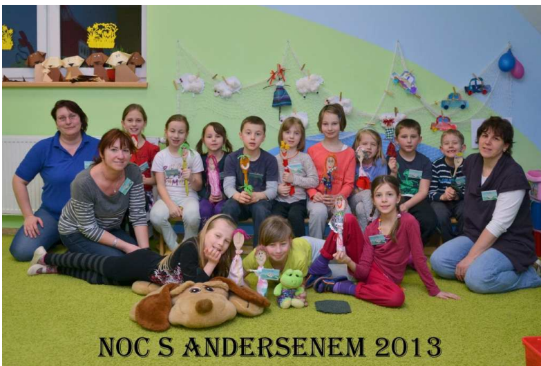
NOC S ANDERSENEM 2013

Andersenem o jeho životě a o tom, jak se stal spisovatelem. Následovalo pásmo her a soutěží inspirovaných jeho pohádkami. Děti si na památku vyrobily z různých materiálů pejsky a loutky. Samozřejmě ne-