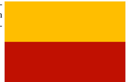
Moravská vlajka v barvách schválených zemským sněmem v roce 1848

Nejčastěji používaná vlajka Moravy byla omylem odvozena z části zemských barev schválených moravským zemským sněmem v roce 1848 – zlaté a červené. Ačkoli nebyla vlajka jako taková nikdy uzákoněna, a ústava z roku 1848 nevešla nikdy v platnost, často se za ni považuje vlajka se dvěma vodorovnými pruhy: zlatý nahoře, červený dole. Vlajka je barvami i uspořádáním totožná s vlajkami některých měst, například pražskou, českobudějovickou, varšavskou či kladskou. Kvůli možné záměně používá v současnosti řada příslušníků moravského hnutí variantu vlajky se zlatočerveně šachovanou orlicí, moravským zemským znakem.