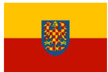
Moravská vlajka se zlatočerveně šachovanou orlicí, používaná příznivci moravského hnutí kvůli možné záměně s jinými vlajkami